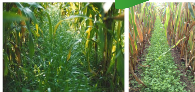
Semis dans les interrangs du maïs : ray-grass à gauche et trèfle blanc à droite.

Le semis dans l'inter-rang de maïs consiste en l'implantation d'un couvert de graminées (p.ex. ray-grass, fétuque), de légumineuses (p.ex. trèfle) ou de plusieurs espèces en mélange, dans les inter-rangs, présent simultanément à la culture principale.