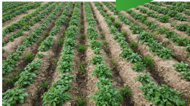
Photo: Céréales semés dans les interbuttes au niveau des diguettes – état au 09 juin 2021 (crédit photo : Max Stadler – GKB)

L'ensemencement des diguettes consiste à implanter un couvert végétal directement sur les micro-barrages (diguettes) formés entre les buttes de pommes de terre ou autres légumes sur buttes.