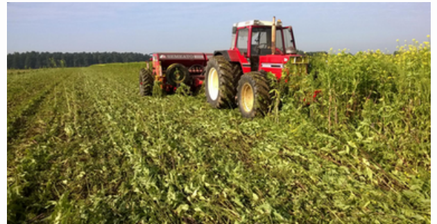
Semis direct dans un couvert vivant (moutarde).