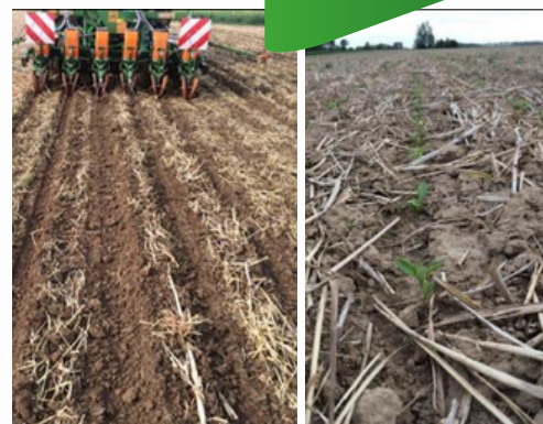
Strip-till dans des résidus de culture.

Le strip-till (ou travail en bandes) est une technique de travail du sol uniquement localisé sur la ligne de semis d'une largeur maximale de 30cm tandis que le reste du champ est non travaillé et présente une couverture de sol. Cette méthode combine les avantages du semis direct (réduction de l'érosion, préservation de la structure du sol) avec ceux du travail localisé (meilleure levée, réchauffement local du sol).