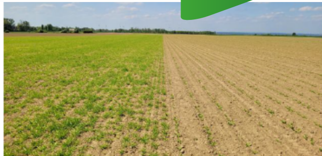
Photo: à gauche: betterave implantée avec orge en inter rang et à droite: betterave seule dans la cadre du projet VIROBETT

L'association culturale betterave-céréale consiste à semer simultanément ou en décalé une céréale (orge ou avoine) entre les rangs de la betterave sucrière sur la même parcelle. Cette technique est issue des essais concernant la jaunisse nanisante, avec un bénéfice secondaire sur l'érosion.