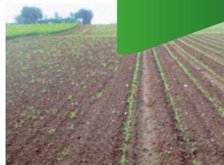
A gauche : semis réparti, à droite semis classique en ligne. Source association AREAS (France)