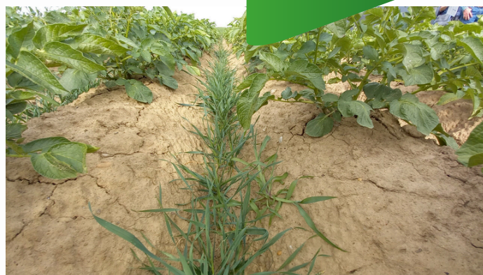
Photo: Cloisonnements avec semis de céréales dans les interbuttes par la FIWAP

Le semis de l'inter-rang en culture de pommes de terre ou autres légumes sur butte consiste à planter des céréales (comme l'orge ou l'avoine) ou des graminées dans l'inter-rang. Cette couverture végétale permet de stabiliser les interrangs. Cette technique doit être associée aux techniques culturales simplifiées pour répondre aux exigences de la BCAE 5.