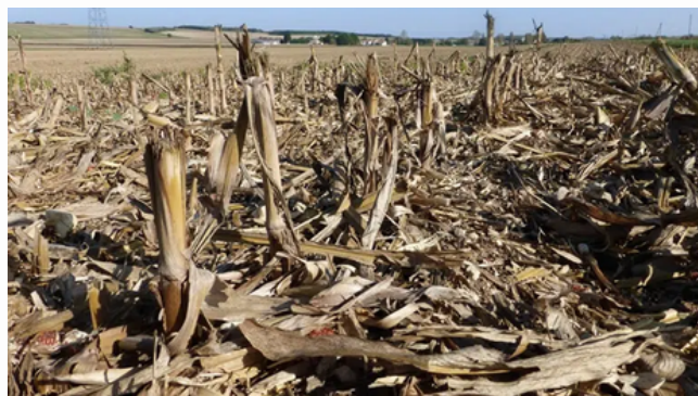
Résidus après récolte de maïs grain.