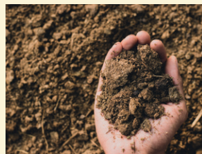
Améliorer la structure des sols et leur teneur en carbone