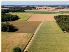
Adapter les pratiques culturales et le calendrier des rotations