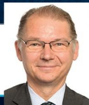
Philippe Lamberts, conseiller à la transition vers une économie climatiquement neutre auprès d'Ursula von der Leyen.