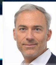
Yvan Verougstraete député européen