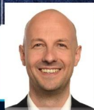
Marc Botenga député européen