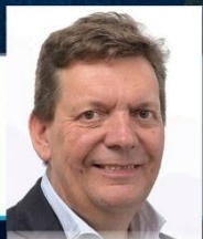
Benoît Cassart député européen