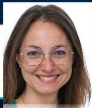
Saskia Bricmont députée européenne